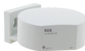
TS-ACC-FE Número: 92683

Consumo de corrente: 10 mA Temperatura ambiente: +5 °C até +35 °C Involucro: POM, PC