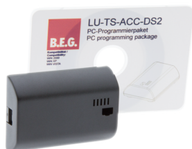
TS-ACC-DS2 Número: 92685

Tensão: 230 V AC 50 / 60 Hz Consumo de corrente: 10 mA Temperatura ambiente: 5 °C até +35 °C