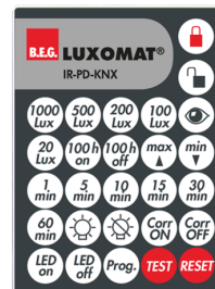
IR-PD-KNX Número: 92123

Dimensões: 47 x 19 x 10 mm Grau de proteção / Classe de Isolamento: IP20 Temperatura ambiente: -20 °C até +40 °C