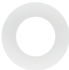
Anel de cobertura PD9 Ø 36 mm Número: 92238

Dimensões: Ø 36 mm Involucro: Policarbonato resistente aos raios UV Cor do material: antracite brilho