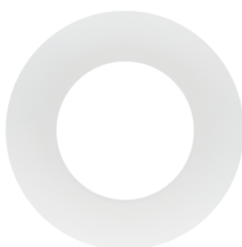
Anel de cobertura PD9 Ø 36 mm Número: 92238

Dimensões: Ø 36 mm Involucro: Policarbonato resistente aos raios UV Cor do material: antracite brilho