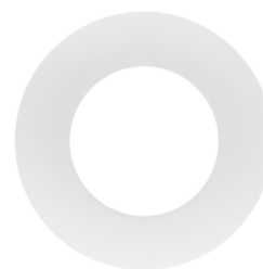
Anel de cobertura PD9 Ø 36 mm Número: 92238

Grau de proteção / Classe de Isolamento: IP65 Involucro: resistente aos raios UV Cor do material: transparente