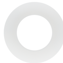
Anel de cobertura PD9 Ø 36 mm Número: 92238

Dimensões: Ø 36 mm Involucro: Policarbonato resistente aos raios UV Cor do material: antracite brilho