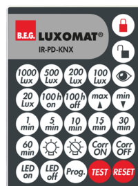
IR-PD-KNX Número: 92123

Dimensões: 47 x 19 x 10 mm Grau de proteção / Classe de Isolamento: IP20 Temperatura ambiente: -20 °C até +40 °C