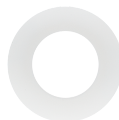
Anel de cobertura PD9 Ø 36 mm Número: 92238

Dimensões: Ø 36 mm Involucro: Policarbonato resistente aos raios UV Cor do material: antracite brilho