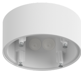
Conjunto de montagem de superfície SM IP54 PD4N H Número: 93787

Tensão: 230 V AC \pm 10\% 50 Hz Dimensões: \varnothing 106 x 95 mm Alimentação: aprox. 3 W