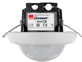
PD4N-M-DACO-DUO DALI-2 Número: 93461

Para obter o conjunto de acordo com as especificações técnicas, é necessário encomendar os artigos indicados.