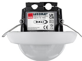
PD4N-M-DACO-1C DALI-2 Número: 93463

Para obter o conjunto de acordo com as especificações técnicas, é necessário encomendar os artigos indicados.