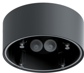
Conjunto de montagem de superfície SM IP54 PD4N H Número: 93786

Tensão: 230 V AC \pm 10\% 50 Hz Dimensões: \varnothing 106 x 95 mm Alimentação: aprox. 2 W