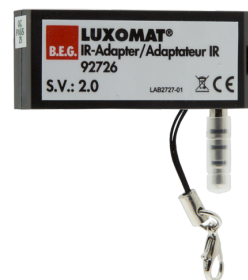
Adaptador IV para smartphones Número: 92726

Dimensões: 40 x 55 x 103 mm Cor do material: Preto Frequência: 2.4 GHz Banda ISM , GFSK 0.2 dBm + 5.3 dBi = 5.5 dBm