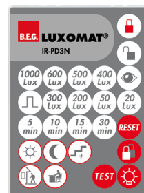
IR-PD3N Número: 92105

Dimensões: 40 x 55 x 103 mm Cor do material: Preto Frequência: 2.4 GHz Banda ISM , GFSK 0.2 dBm + 5.3 dBi = 5.5 dBm