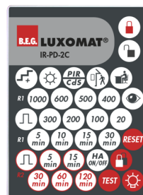
IR-PD-2C Número: 92475

Dimensões: 40 x 55 x 103 mm Cor do material: Preto Frequência: 2.4 GHz Banda ISM , GFSK 0.2 dBm + 5.3 dBi = 5.5 dBm