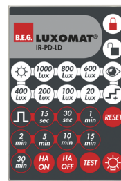
IR-PD-LD Número: 92479

Involucro: Policarbonato resistente aos raios UV Cor do material: transparente