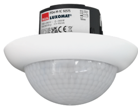
PD4-M-1C-FM Número: 92575

Para obter o conjunto de acordo com as especificações técnicas, é necessário encomendar os artigos indicados.