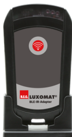
BLE-IV-Adaptador Número: 93067

Tensão: 230 V AC ±10% Dimensões: 38 x 12 x 26 mm Grau de proteção / Classe de Isolamento: IP20 / Classe II