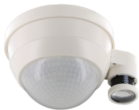
PD4-CAS2-GH DALI-2 Número: 93478

Para obter o conjunto de acordo com as especificações técnicas, é necessário encomendar os artigos indicados.