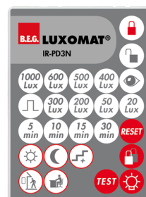
IR-PD3N Número: 92105

Dimensões: 40 x 55 x 103 mm Cor do material: Preto Frequência: 2.4 GHz Banda ISM , GFSK 0.2 dBm + 5.3 dBi = 5.5 dBm