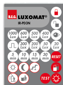
IR-PD3N Número: 92105

Dimensões: 40 x 55 x 103 mm Cor do material: Preto Frequência: 2.4 GHz Banda ISM , GFSK 0.2 dBm + 5.3 dBi = 5.5 dBm