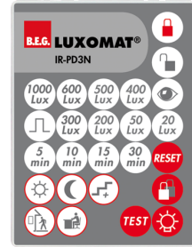
IR-PD3N Número: 92105

Dimensões: \varnothing 200 x 90 mm Resistência ao choque: IK09 Involucro: cesta de aço revestida