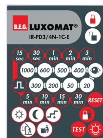
IR-PD3/4N-1C-E Número: 93110

Dimensões: 40 x 55 x 103 mm Cor do material: Preto Frequência: 2.4 GHz Banda ISM , GFSK 0.2 dBm + 5.3 dBi = 5.5 dBm