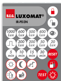
IR-PD3N Número: 92105

Bateria: 3.0 V lítio CR2032 (incluída) Dimensões: 80 x 60 x 8 mm Cor do material: -