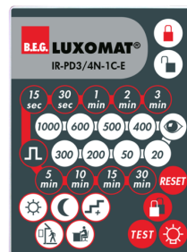
IR-PD3/4N-1C-E Número: 93110

Dimensões: 40 x 55 x 103 mm Cor do material: Preto Frequência: 2.4 GHz Banda ISM , GFSK 0.2 dBm + 5.3 dBi = 5.5 dBm