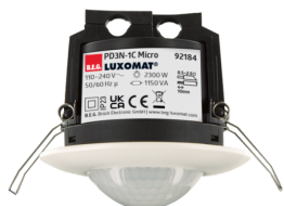
PD3N-1C-FC Micro Número: 92184

Para obter o conjunto de acordo com as especificações técnicas, é necessário encomendar os artigos indicados.