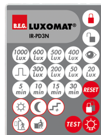
IR-PD3N Número: 92105

Dimensões: 40 x 55 x 103 mm Cor do material: Preto Frequência: 2.4 GHz Banda ISM , GFSK 0.2 dBm + 5.3 dBi = 5.5 dBm