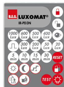
IR-PD3N Número: 92105

Dimensões: 40 x 55 x 103 mm Cor do material: Preto Frequência: 2.4 GHz Banda ISM , GFSK 0.2 dBm + 5.3 dBi = 5.5 dBm