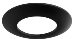
Anel de cobertura PD3N FC Número: 93086

Dimensões: 83 x 83 x 8 mm Involucro: Policarbonato resistente aos raios UV Cor do material: Branco mate, semelhante RAL9010