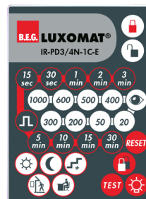
IR-PD3/4N-1C-E Número: 93110

Dimensões: 40 x 55 x 103 mm Cor do material: Preto Frequência: 2.4 GHz Banda ISM , GFSK 0.2 dBm + 5.3 dBi = 5.5 dBm