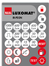
IR-PD3N Número: 92105

Bateria: 3.0 V lítio CR2032 (incluída) Dimensões: 80 x 60 x 8 mm Cor do material: -