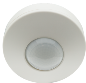
PD3-1C-SM Número: 92194

Para obter o conjunto de acordo com as especificações técnicas, é necessário encomendar os artigos indicados.