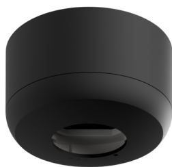
Conjunto de montagem de superfície SM IP54 PD2N H Número: 93783

Tensão: 230 V AC \pm 10\% 50 / 60 Hz Dimensões: \varnothing 83 x 81 mm Alimentação: 1 W