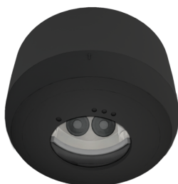
Conjunto de montagem de superfície SM IP54 PD2N H Número: 93783

Tensão: 230 V AC \pm 10\% 50 / 60 Hz Dimensões: \varnothing 83 x 81 mm Alimentação: 1 W