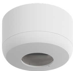
Conjunto de montagem de superfície SM IP54 PD2N H Número: 93782

Tensão: 230 V AC \pm 10\% 50 / 60 Hz Dimensões: \varnothing 83 x 81 mm Alimentação: 1 W