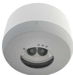
Conjunto de montagem de superfície SM IP54 PD2N H Número: 93782

Tensão: 230 V AC \pm 10\% 50 / 60 Hz Dimensões: \varnothing 83 x 81 mm Alimentação: 1 W