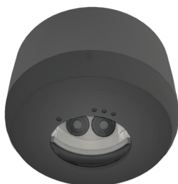
Conjunto de montagem de superfície SM IP54 PD2N H Número: 93781

Tensão: 230 V AC \pm 10\% 50 / 60 Hz Dimensões: \varnothing 83 x 81 mm Alimentação: 1 W