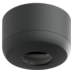
Conjunto de montagem de superfície SM IP54 PD2N H Número: 93781

Tensão: 230 V AC \pm 10\% 50 / 60 Hz Dimensões: \varnothing 83 x 81 mm Alimentação: 1 W