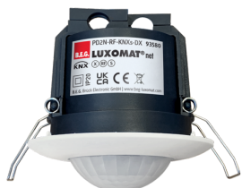
PD2N-RF-KNXs-DX-FC Número: 93580

Para obter o conjunto de acordo com as especificações técnicas, é necessário encomendar os artigos indicados.