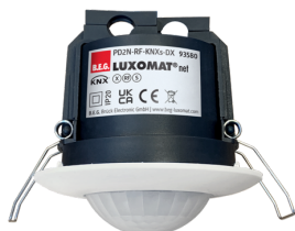
PD2N-RF-KNXs-DX-FC Número: 93580

Para obter o conjunto de acordo com as especificações técnicas, é necessário encomendar os artigos indicados.