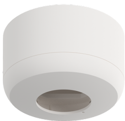
Conjunto de montagem de superfície SM IP54 PD2N H Número: 93454

Tensão: 230 V AC \pm 10\% 50 / 60 Hz Dimensões: \varnothing 83 x 81 mm Alimentação: 1 W