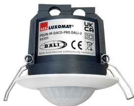
PD2N-M-DACO-PRO DALI-2 Número: 93351

Para obter o conjunto de acordo com as especificações técnicas, é necessário encomendar os artigos indicados.