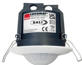
PD2N-M-DACO-1C DALI-2 Número: 93455

Para obter o conjunto de acordo com as especificações técnicas, é necessário encomendar os artigos indicados.