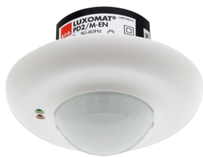
PD2-M-2C-FM Número: 92155

Para obter o conjunto de acordo com as especificações técnicas, é necessário encomendar os artigos indicados.