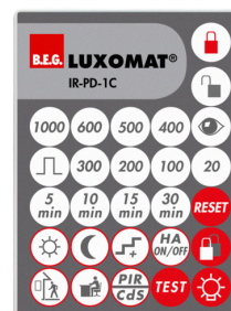
IR-PD-1C Número: 92520

Dimensões: 40 x 55 x 103 mm Cor do material: Preto Frequência: 2.4 GHz Banda ISM , GFSK 0.2 dBm + 5.3 dBi = 5.5 dBm