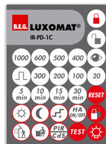
IR-PD-1C Número: 92520

Dimensões: 40 x 55 x 103 mm Cor do material: Preto Frequência: 2.4 GHz Banda ISM , GFSK 0.2 dBm + 5.3 dBi = 5.5 dBm