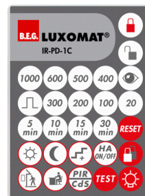
IR-PD-1C Número: 92520

Dimensões: 40 x 55 x 103 mm Cor do material: Preto Frequência: 2.4 GHz Banda ISM , GFSK 0.2 dBm + 5.3 dBi = 5.5 dBm