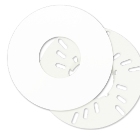
Montagem de parede Set / PD11 Número: 92833

Bateria: 3.0 V lítio CR2032 (incluída) Dimensões: 57 x 35 x 7 mm Cor do material: -