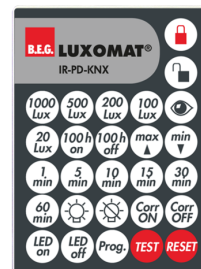
IR-PD-KNX Número: 92123

Grau de proteção / Classe de Isolamento: IP54 Involucro: Policarbonato resistente aos raios UV Cor do material: Branco