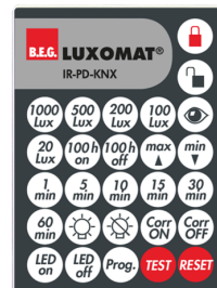
IR-PD-KNX Número: 92123

Dimensões: 47 x 19 x 10 mm Grau de proteção / Classe de Isolamento: IP20 Temperatura ambiente: -20 °C até +40 °C