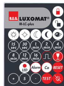
IR-LC-plus Número: 92095

Dimensões: 40 x 55 x 103 mm Cor do material: Preto Frequência: 2.4 GHz Banda ISM , GFSK 0.2 dBm + 5.3 dBi = 5.5 dBm