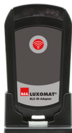
BLE-IV-Adaptador Número: 93067

Tensão: 230 V AC ±10% Dimensões: 38 x 12 x 26 mm Grau de proteção / Classe de Isolamento: IP20 / Classe II