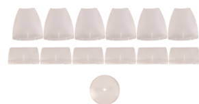
Máscaras LC-plus 280 Número: 32698

Dimensões: 188 x 98 x 134 mm Cor do material: Branco