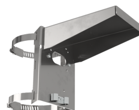
Suporte de poste - Proteção contra elementos meteorológicos Número: 93220

Dimensões: Ø 164 x 143 mm Resistência ao choque: IK09 Involucro: cesta de aço revestida