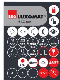
IR-LC-plus Número: 92095

Dimensões: 40 x 55 x 103 mm Cor do material: Preto Frequência: 2.4 GHz Banda ISM , GFSK 0.2 dBm + 5.3 dBi = 5.5 dBm