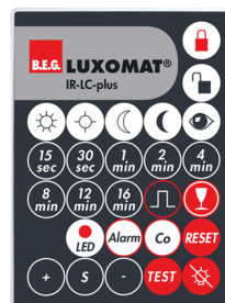
IR-LC-plus Número: 92095

Dimensões: 40 x 55 x 103 mm Cor do material: Preto Frequência: 2.4 GHz Banda ISM , GFSK 0.2 dBm + 5.3 dBi = 5.5 dBm