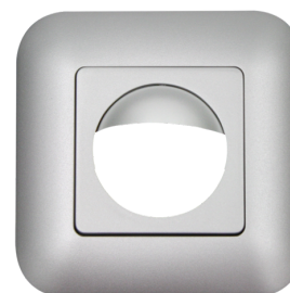
Moldura IP20 Indoor 180 Número: 92633

Dimensões: 86 x 86 mm Grau de proteção / Classe de Isolamento: IP20 Involucro: Policarbonato resistente aos raios UV