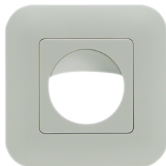
Moldura IP20 Indoor 180 Número: 92631

Dimensões: 86 x 86 mm Grau de proteção / Classe de Isolamento: IP20 Involucro: Policarbonato resistente aos raios UV