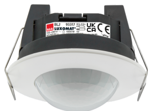
BL2-FC Número: 93317

Para obter o conjunto de acordo com as especificações técnicas, é necessário encomendar os artigos indicados.