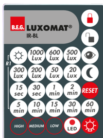
IR-BL Número: 93055

Dimensões: \varnothing 109 x 50 mm Grau de proteção / Classe de Isolamento: IP23 Cor do material: Branco