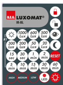
IR-BL Número: 93055

Dimensões: \varnothing 109 x 50 mm Grau de proteção / Classe de Isolamento: IP23 Cor do material: Branco