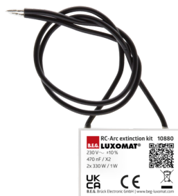
Kit RC supressor de arco elétrico Número: 10880

Tensão: 230 V AC \pm 10\% Dimensões: 38 x 12 x 26 mm Grau de proteção / Classe de Isolamento: IP20 / Classe II