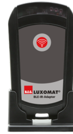
BLE-IV-Adaptador Número: 93067

Bateria: 3.0 V lítio CR2032 (incluída) Dimensões: 80 x 60 x 8 mm Invólucro: Policarbonato resistente aos raios UV