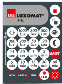
IR-BL Número: 93055

Tensão: 230 V AC ±10% Dimensões: 38 x 12 x 26 mm Grau de proteção / Classe de Isolamento: IP20 / Classe II