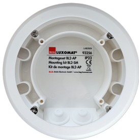
Kit de montagem BL2-SM Número: 93256

Dimensões: 40 x 55 x 103 mm Cor do material: Preto Frequência: 2.4 GHz Banda ISM , GFSK 0.2 dBm + 5.3 dBi = 5.5 dBm