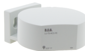
TS-ACC-FE Número: 92683

Consumo de corrente: 10 mA Temperatura ambiente: +5 °C até +35 °C Involucro: POM, PC