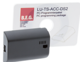
TS-ACC-DS2 Número: 92685

Tensão: 230 V AC 50 / 60 Hz Consumo de corrente: 10 mA Temperatura ambiente: +5 °C até +35 °C