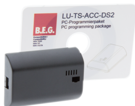
TS-ACC-DS2 Número: 92685

Tensão: 230 V AC 50 / 60 Hz Consumo de corrente: 10 mA Temperatura ambiente: +5 °C até +35 °C