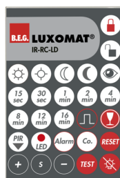
IR-RC-LD Número: 92649

Bateria: 3.0 V lítio CR2032 (incluída) Dimensões: 80 x 60 x 8 mm Cor do material: -