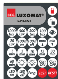
IR-PD-KNX Número: 92123

Dimensões: 47 x 19 x 10 mm Grau de proteção / Classe de Isolamento: IP20 Temperatura ambiente: -20 °C até +40 °C