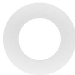
Anel de cobertura PD9 Ø 36 mm Número: 92238

Tensão: 24 V DC Dimensões: Ø 45 x 28 mm Área de deteção: horizontal 360° (Montagem no tecto)