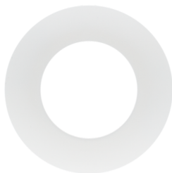
Anel de cobertura PD9 Ø 36 mm Número: 92238

Dimensões: Ø 36 mm Involucro: Policarbonato resistente aos raios UV Cor do material: antracite brilho