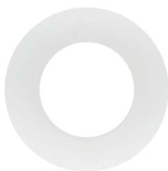
Anel de cobertura PD9 Ø 36 mm Número: 92238

Dimensões: Ø 36 mm Involucro: Policarbonato resistente aos raios UV Cor do material: antracite brilho