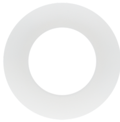
Anel de cobertura PD9 Ø 36 mm Número: 92238

Dimensões: Ø 36 mm Involucro: Policarbonato resistente aos raios UV Cor do material: antracite brilho