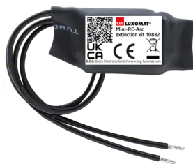
Mini kit RC supressor de arco elétrico Número: 10882

Tensão: 230 V AC ±10% Dimensões: 38 x 12 x 26 mm Grau de proteção / Classe de Isolamento: IP20 / Classe II