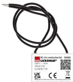
Kit RC supressor de arco elétrico Número: 10880

Bateria: 3.0 V lítio CR2032 (incluída) Dimensões: 57 x 35 x 7 mm Cor do material: -